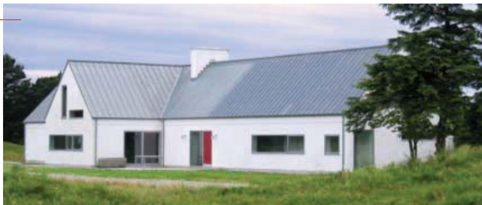
Illustration: Hanne Birk

Renovering af arkitekt og pædagog Hanne Birk. Her bevares det særlige ved landbrugets boligbyggeri.