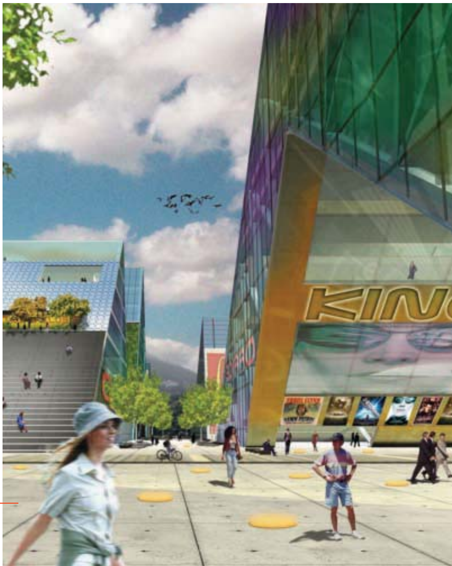
Illustration: PLOT = BIG+JDS

Den unge danske tegnestue PLOT har arbejdet på at skabe lys og udsigt for alle lejligheder i boligkomplekset, der er formet som bogstaverne V og M.