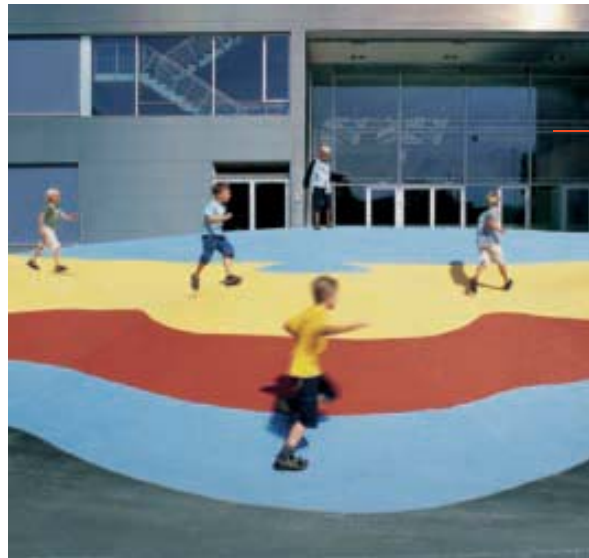
HELLERUP SKOLE Skolen er tegnet af Arkitema ud fra et princip om åbenhed mellem både rum og mennesker. Rummene er gjort fleksible med flytbare vægge og inventar. Illustration: David Trood

Forsvarets Bygningstjeneste har en 300 år lang tradition for at bygge med stor teknisk og arkitektonisk kvalitet. Mange af de bygninger, der er opført gennem tiden, er stadig tilknyttet Forsvaret. Indtil nu har Forsvarets Bygningstjeneste været ansvarlig for arkitektur og nybyggeri i Forsvaret. Det arbej-