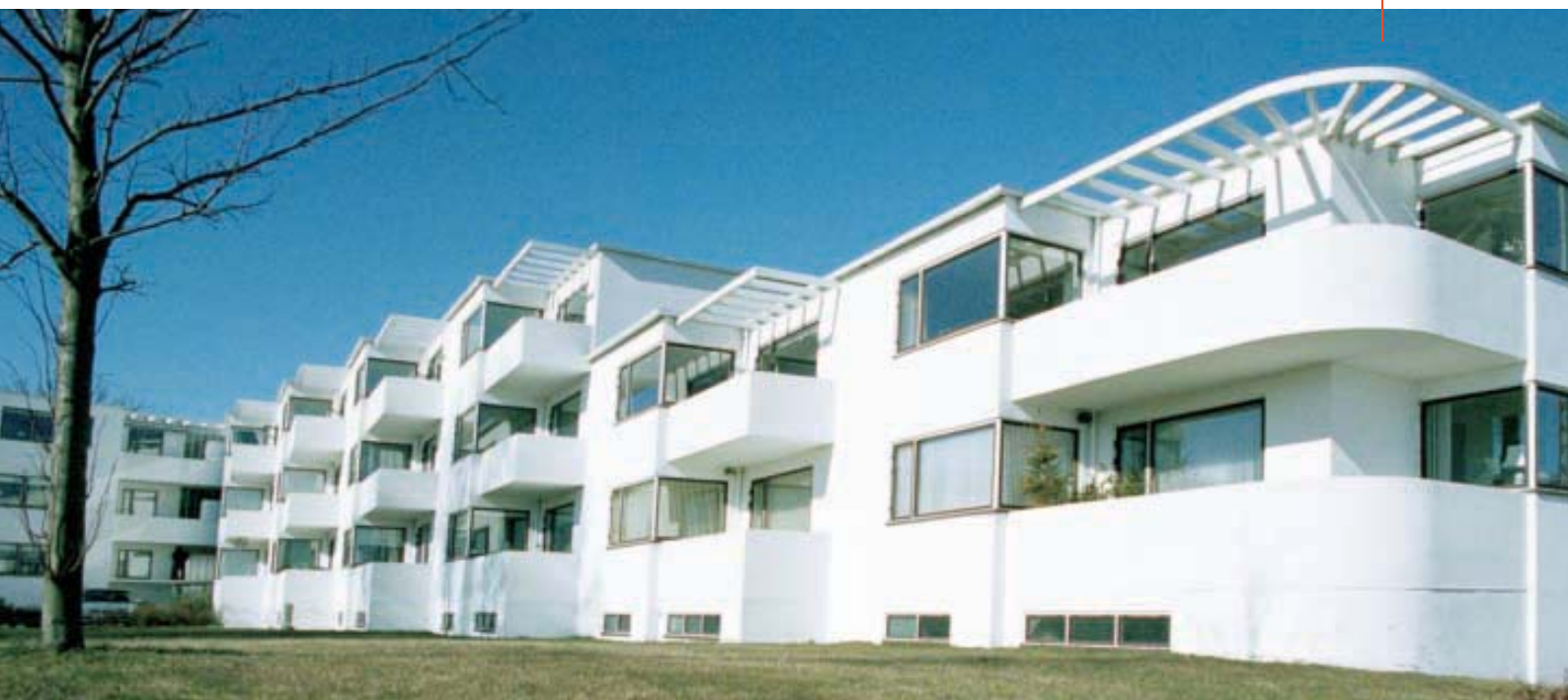
Illustration: Helga Theilgaard

Arne Jacobsens boligbyggeri fra 1937 er et af de fornemste eksempler på modernistisk arkitektur i Danmark.