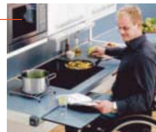
Illustration: Pressalit Care

Designet af 3PART til mennesker med nedsat funktionsevne og deres pårørende.