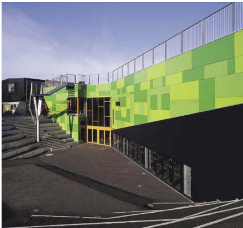
Illustration: aart a/s

Den danske tegnestue aarts vinderforslag til Sametinget, hvor fokus er på bevaring og udvikling af samisk kulturarv.