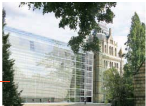
Illustration: C.F. Møller

C.F. Møllers puppeformede bygning skal danne rammerne for en samling af millioner af forskellige insekter og planter – og tusinder af besøgende hvert år.