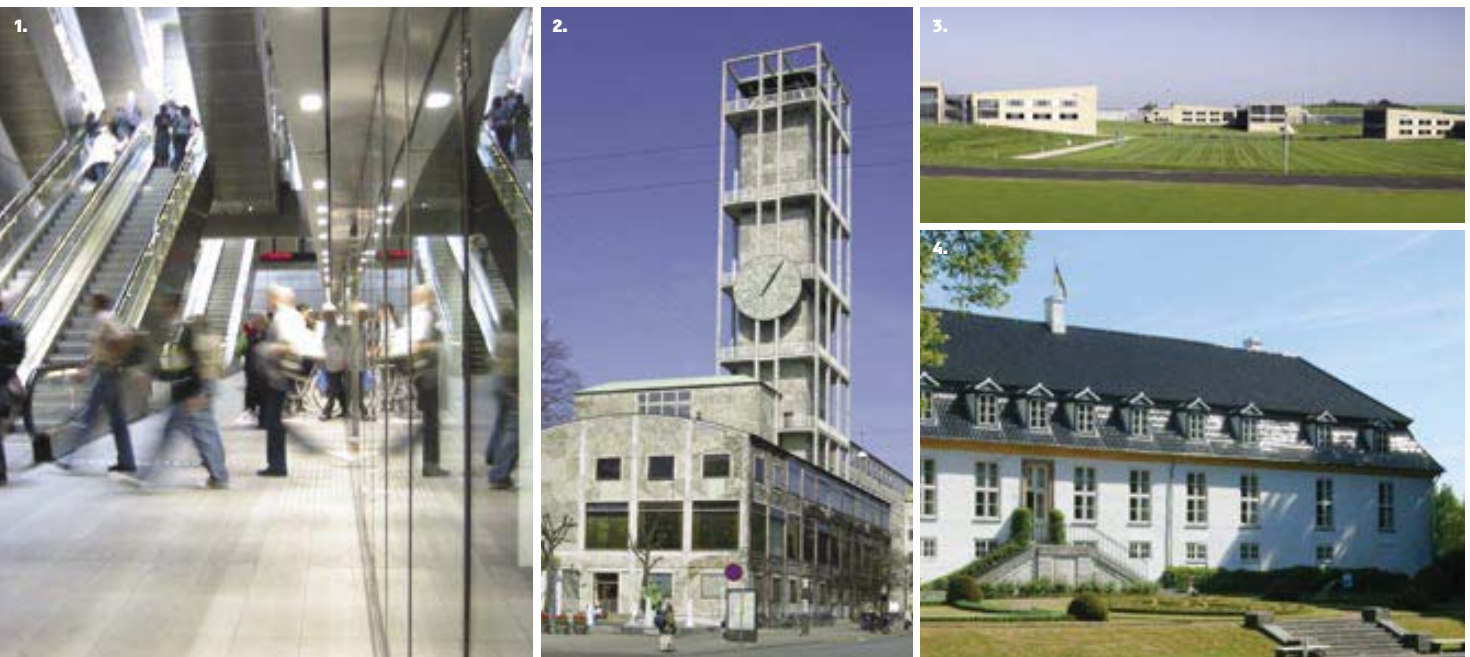
Illustration: schmidt hammer lassen

Kunstmuseet Aros i Århus gennemskæres af et stort buet rumforløb, der som en offentlig stiftorbindelse forbinder gader og pladser på hver sin side af museet. Samtidigt synliggør museets skulpturelle trappeanlæg bygningens 10 etager.