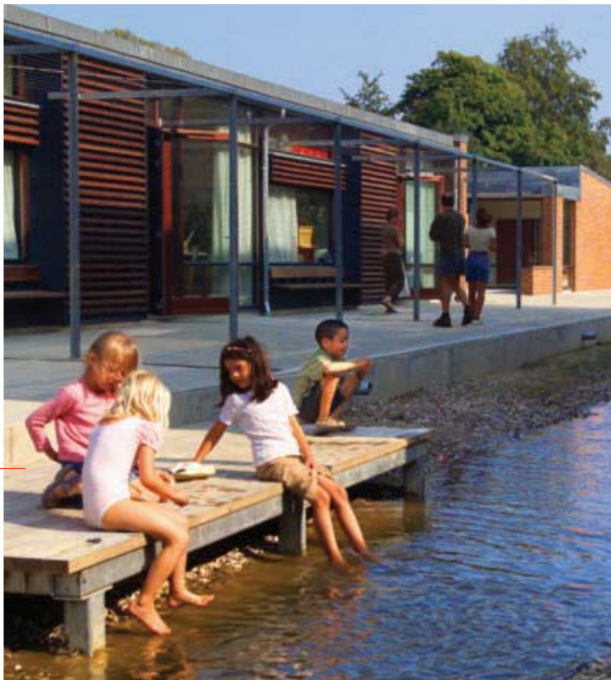
Illustration: Tegnestuen Vandkunsten

Tegnestuens Vandkunstens økologisk boligbyggeri undersøger mulighederne for energibesparelser gennem zoneindeltdelt indretning.