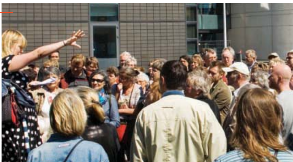
Illustration: Lina Ahnoff

god arkitektur er, men at sikre, at offentligheden kan forholde sig til – og stille krav til – arkitekturen. Debat og engagement fremmer nemlig kvaliteten.