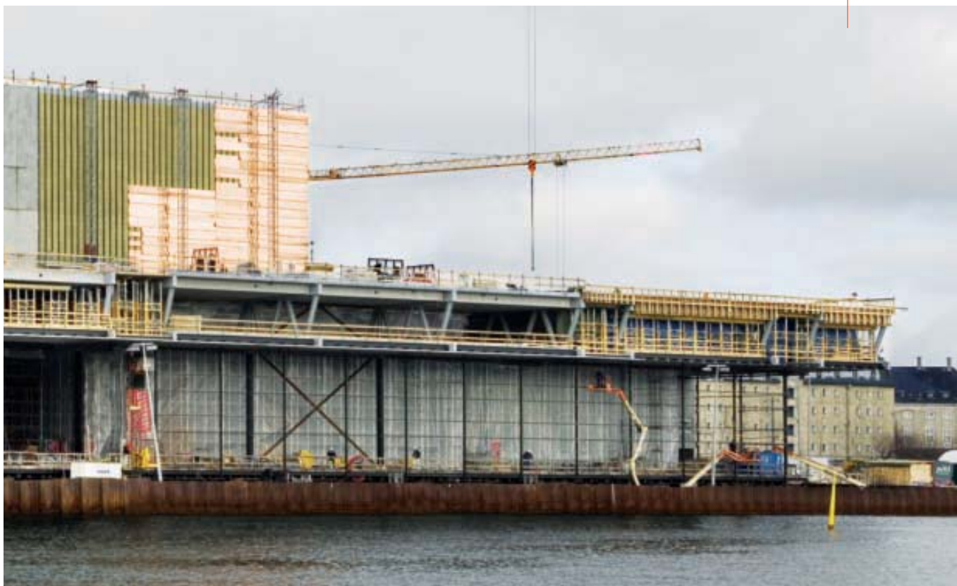
Illustration: Lundgaard & Tranberg

Lundgaard & Tranbergs byggeri er beklædt med kobber, glas og solceller. Bygningen åbner sig mod havnefronten og Operaen på den anden side af havneløbet.