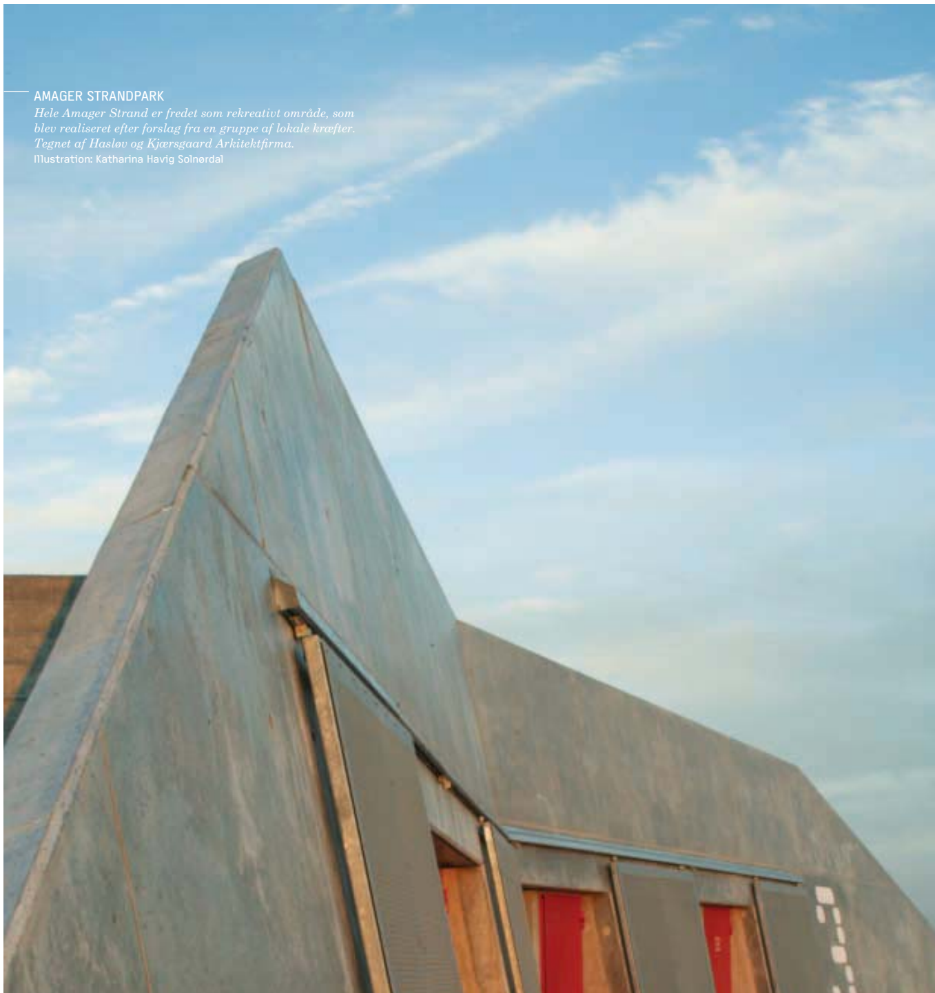
Illustration: Katharina Havig Solnørdal

Der er således perspektiv i at styrke dialogen om planlægning som redskab til at sikre kvalitet i både det bebyggede miljø og vore landskaber. Planredskabet findes, og kommunerne bruger det, men det skal debatteres, hvordan det benyttes.